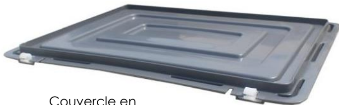
Couvercle en option