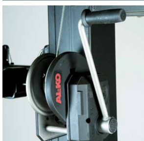
Treuil anti-retour freiné