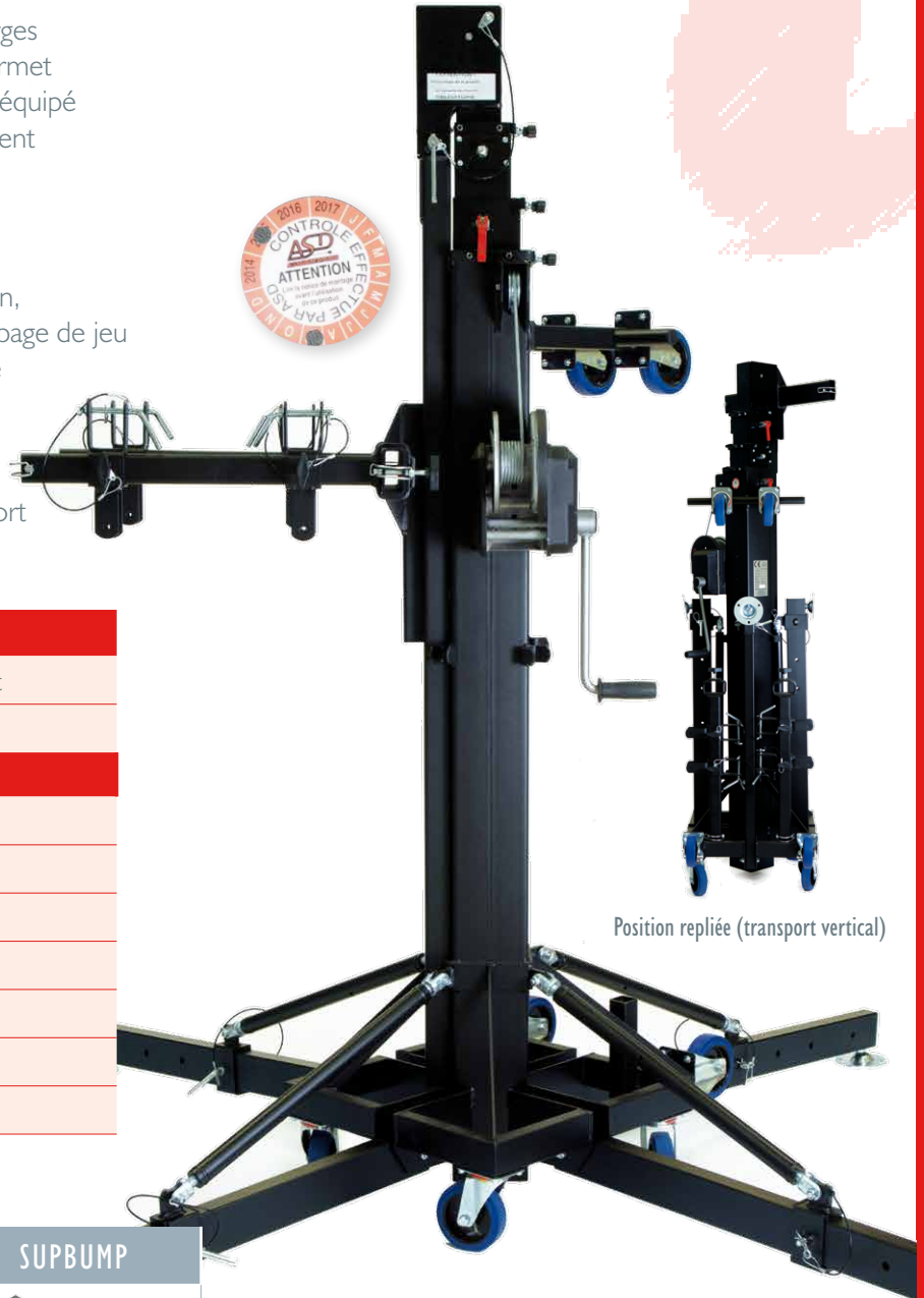
Position repliée (transport vertical)