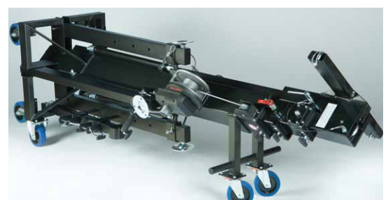
Position transport couchée