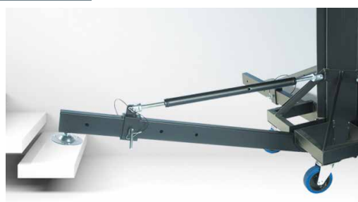
4 pattes indépendantes montées sur vérin