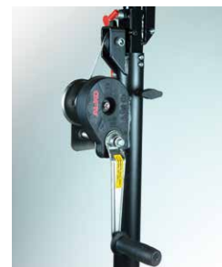
Treuil anti-retour freiné