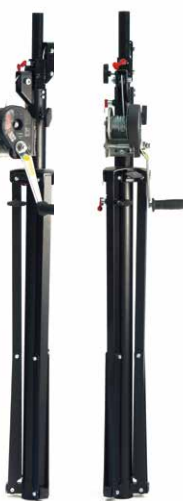
Position repliée (transport vertical)