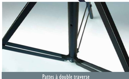
Pattes à double traverse