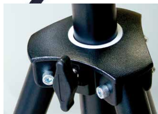
Chariot en aluminium coulé avec molette de serrage sur cale polyamide et bague téflon